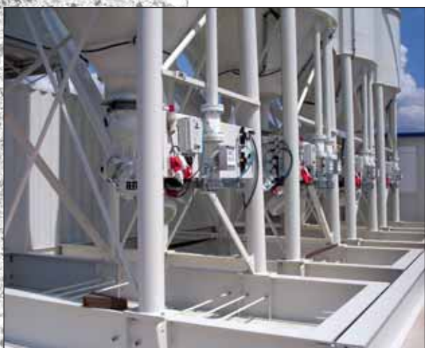
Schnellmontagesilos auf transportablem Fundamentrahmen (vor dem Ausbetonieren) Quick erection silos on transportable foundation frame (before filling in with concrete)