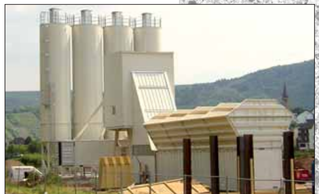
ELBA Supermobil ESM 105