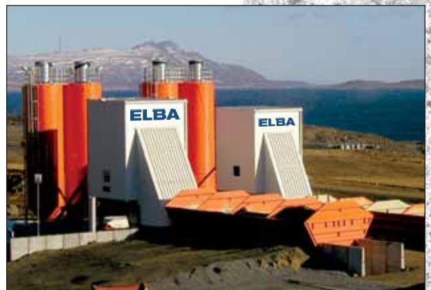
ELBA Supermobil ESM 105 und ESM 60