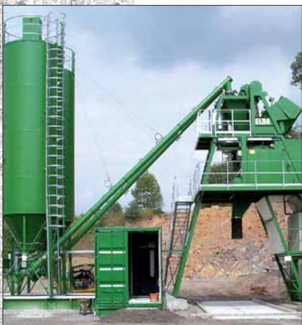
ELBA Supermobil ESM 110

ELBA bietet eine völlig neue Konzeption für mobile, lineare Mischanlagen.