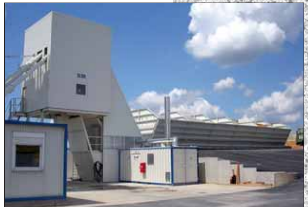
ELBA Supermobil ESM 105

The strict application of bolted connections (pins and wedges) ensures a consequent mobile technique and allows shortest erection times.